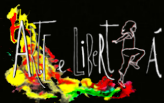
illustrazione di Luca Di Napoli

TEATRO CIRCO MUSICA CINEMA DANZA CONVEGNI